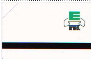
15661 / 15662 retro