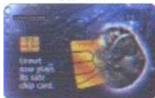
15683/ 15684/ 15685 retro