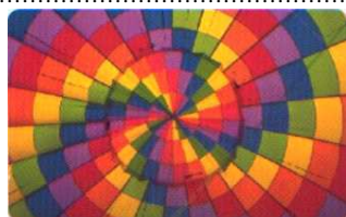
15660 / 15661 verso