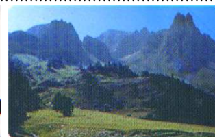
15662/ 63/ 64/ 65 verso