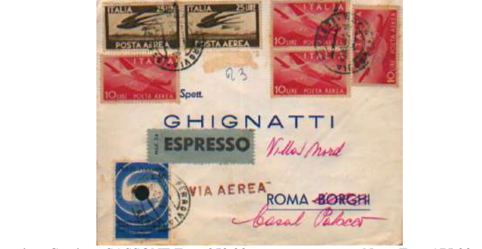
valore Catalogo SASSONE Euro 350,00 ++ Netto Euro 175,00