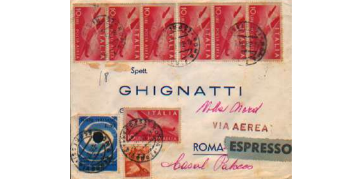
valore Catalogo SASSONE Euro 550,00 ++ Netto Euro 275,00