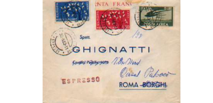
valore Catalogo SASSONE Euro- Netto Euro 25,00