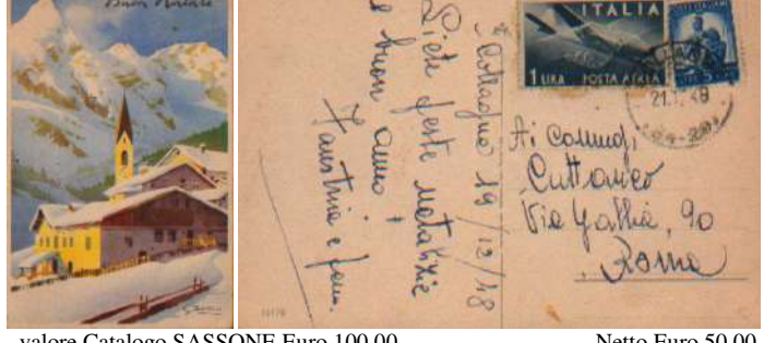
valore Catalogo SASSONE Euro 100,00 Netto Euro 50,00