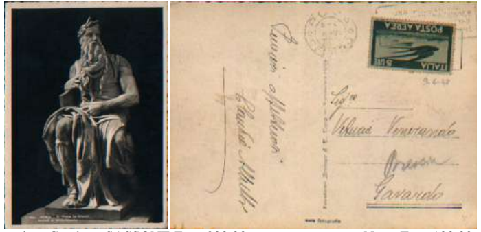
valore Catalogo SASSONE Euro 200,00 Netto Euro 100,00