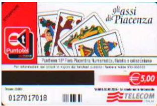
2925/ 2928 retro