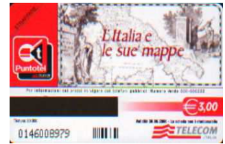
2935/ 2938 verso