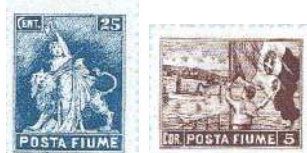
Allegorie e Vedute valori non emessi