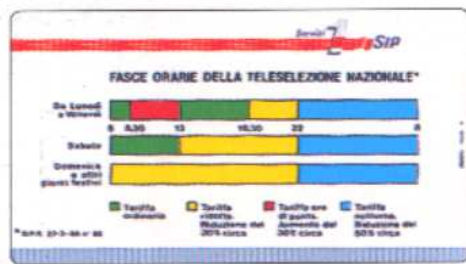
piede piccolo mm 3,5