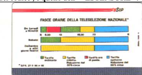
piede grandissimo mm 7

Questo tipo di codificazione, utilizzato per prima dalla ditta PIKAPPA (vedi schede n. 184, 185) è adottato, via via, da tutte le Aziende. Per un certo periodo la Technicard / Polaroid non ha utilizzato "L'ESTENSORE", ma una codificazione di quattro numeri. Infatti, controllando i codici numerici della Technicard / Polaroid, da noi pubblicati, vedi il settore che tratta i codici, noteremo che non abbiamo utilizzato il punto di interruzione, tra il numero indicativo del codice, e quello dell' "ESTENSORE".