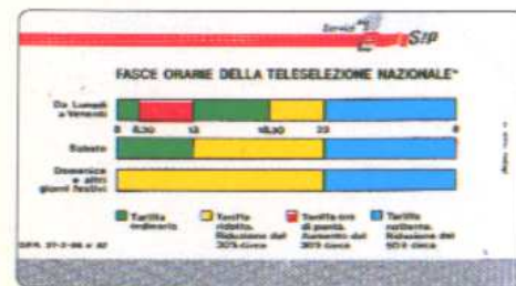
piede grande mm 5,5